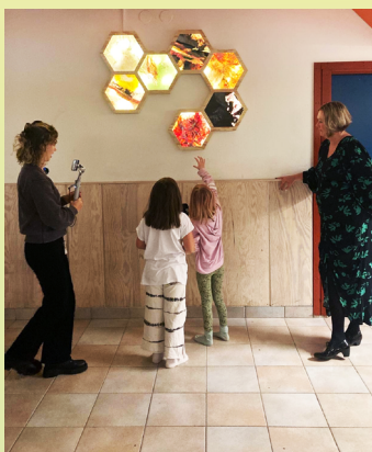
Barn och pedagoger på Rolfstorps skola vid verket Bin av Daniel Diamant.

Webbinarier med tematiken Gestaltad Livsmiljö. En samtalsserie med politiker, tjänstepersoner, arkitekter, designers, konstnärer och forskare m.fl. om hur kommuner och andra aktörer runt om i Sverige arbetar i praktiken.